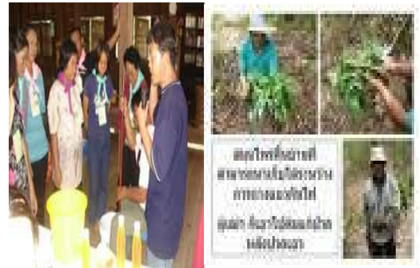
อบรมศึกษาวิชาการ

จะต้องมีเป็นไปอย่างมีเหตุผลโดยพิจารณาจากเหตุปัจจัยที่เกี่ยวข้องตลอดจนคำนึงถึงผลที่คาดว่าจะเกิดขึ้นจากการกระทำดังกล่าวนั้นๆอย่างรอบคอบ