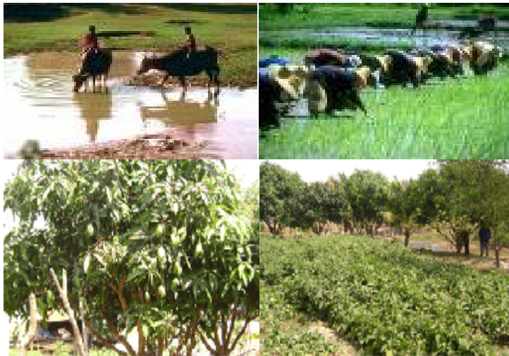
การเพาะปลูกพืชสวนครัวเพื่อการบริโภค

ความพอประมาณ หมายถึงความพอดี ที่ไม่น้อยเกินไปและไม่มากเกินไปโดยไม่เบียดเบียนตนเองและผู้อื่น เช่นการผลิตและการบริโภคที่อยู่ในระดับพอประมาณ