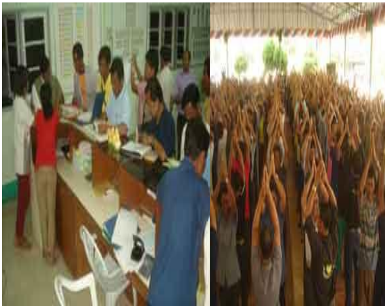
การรวมกลุ่มกันออมทรัพย์ในระดับหมู่บ้าน

การมีภูมิคุ้มกันที่ดีในตัว หมายถึงการเตรียมตัวให้พร้อมรับผลกระทบและการเปลี่ยนแปลงด้านต่างๆ ที่จะเกิดขึ้น โดยคำนึงถึงความเป็นไปได้ของสถานการณ์ต่างๆ ที่คาดว่าจะเกิดขึ้นในอนาคตทั้งใกล้และไกล