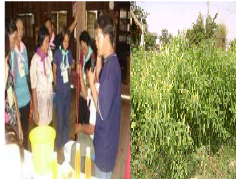
นำผลิตภัณฑ์ที่ผลิตได้มาใช้ในการเกษตร

เงื่อนไขความรู้ มีความรู้เกี่ยวกับวิชาการต่างๆ ที่เกี่ยวข้องอย่างรอบด้าน ความรอบคอบ ที่จะนำความรู้เหล่านั้นมาพิจารณาให้เชื่อมโยงกัน เพื่อประกอบการวางแผน และความระมัดระวังในขั้นปฏิบัติ