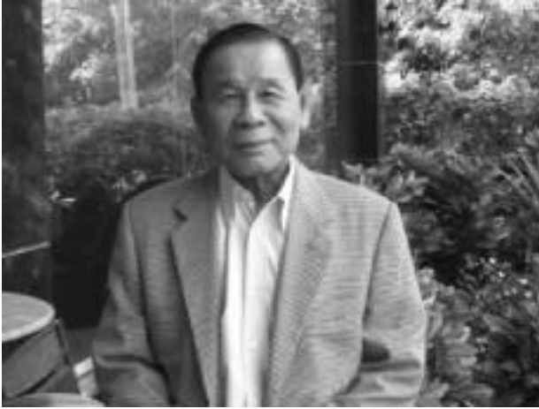
พลอากาศเอกสมบุญ ระหงษ์ จังหวัดสมุทรปราการ