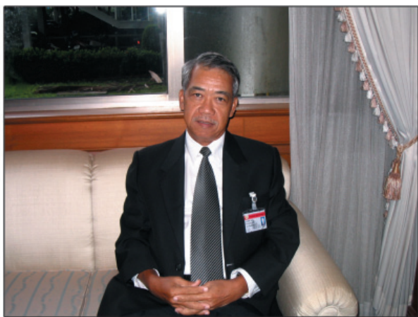
สัมภาษณ์ ส.ส.ลิต ภูมิ์ เขต 4 จังหวัดปทุมธานี