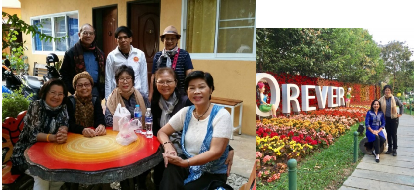
เพื่อนบางคนแอบไปดูงานสวนดอกไม้เชียงใหม่รายแต่เช้า