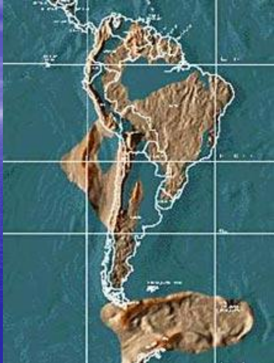
อเมริกาใต้ ANUVATKONGPAN