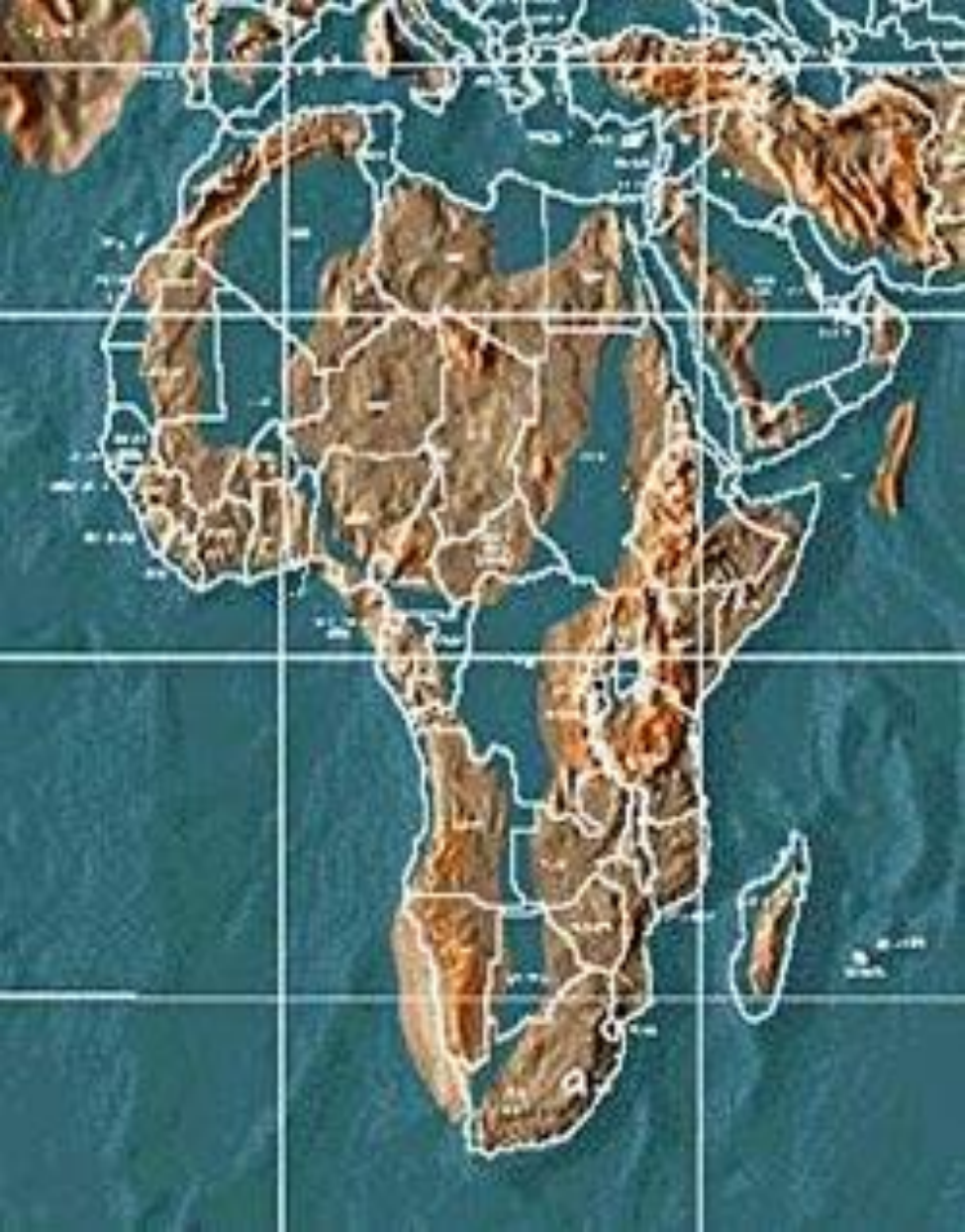
แอฟริกาใต้